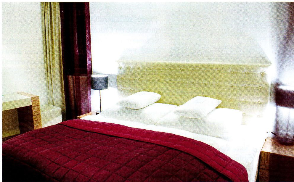
Considéré comme le meilleur lit au monde, le huesler-nest , l'un des points forts de l'hôtel, qui a beaucoup investi sur une literie d'exception.

The Icon boutique Hôtel se situe entre modernité et histoire, puisque le bâtiment d'origine date du XIXe siècle. Dans Nové Mesto , « nouvelle ville » en tchèque, aujourd'hui quartier des artistes, à la lisière du Stare Mesto , il se trouve également à quelques rues du célèbre Musée Mucha ou de la place Venceslas. Icon a été conçu comme un hôtel décontracté et convivial, ce que l'on ressent dès l'arrivée. Le confort des clients n'est pas oublié, pour preuve les lits Hänstens, faits à la main, les meilleurs du monde qui vous garantissent un sommeil exceptionnel, ou les coffres à empreinte digitale, tellement simples d'utilisation. Côté décor, le propriétaire a joué sur le design et la modernité dans les 31 chambres, avec un mélange de couleurs et de matières : Le mobilier Hala se marie avec le parquet en bois, les placards gris et faux bois, et les dessus de lit et rideaux violets.... Les salles de bain en noir et les éléments blancs offrent une touche de style