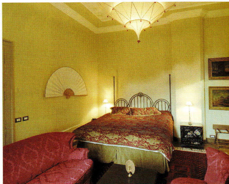
Ici, une chambre orientale dans un camaïeu de vieux roses...