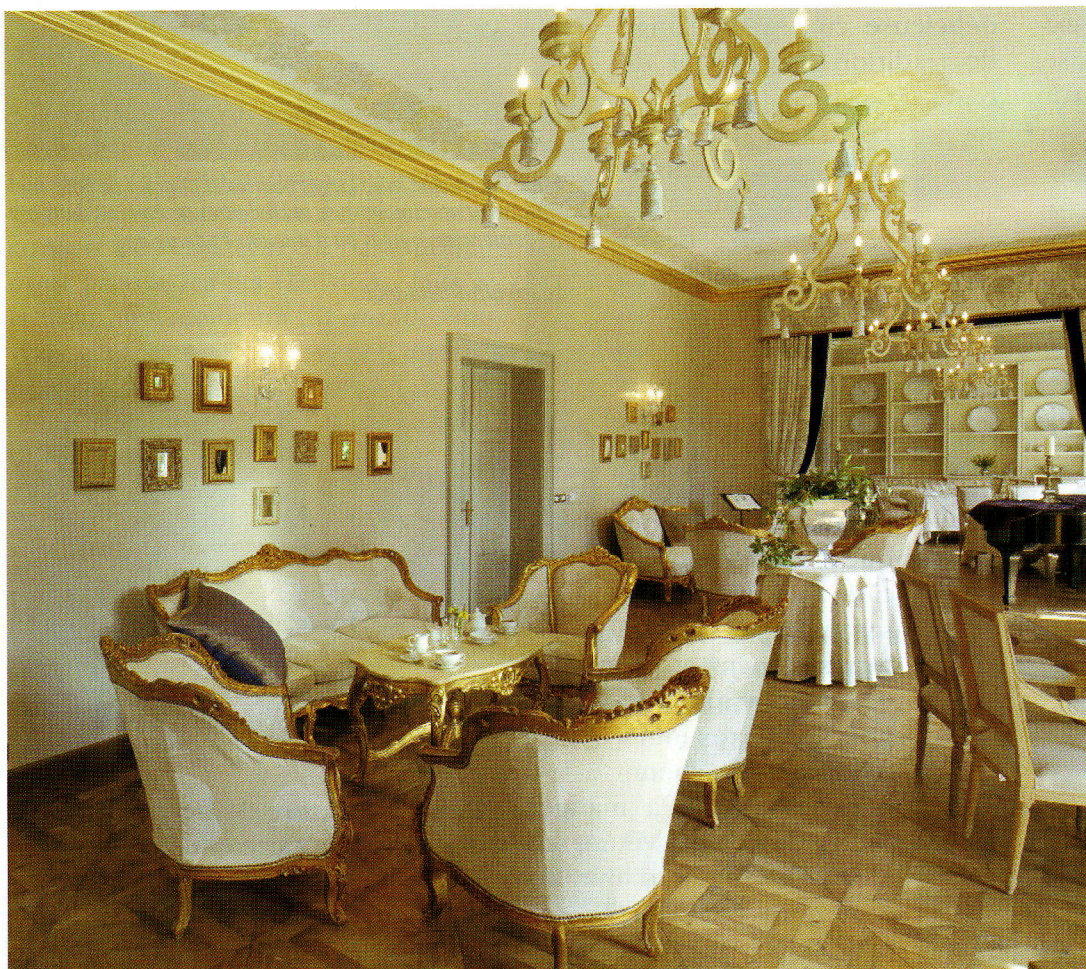
Le grand salon garde toute la prestance de son origine aristocratique, où se mêle à l'or la blancheur immaculée des tissus et des boiseries. Des petits cadres avec miroirs donnent un côté légèrement décalé et constituent un clin d'œil pour une clientèle très jet-set.

Enfin, de nombreuses activités, comme une ballade en calèche, une promenade dans la forêt ou une partie de croquet sur la pelouse, ponctuent des journées trop courtes, tant l'impression de bien-être et de calme envahit ceux qui ont eu la bonne idée de s'arrêter dans ce lieu magique.