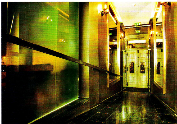
Rendez-vous de la jeunesse branchée de Prague, un hôtel tendance aux teintes très mode. Détail de l'entrée, avec jeu de miroirs, laques et transparences...