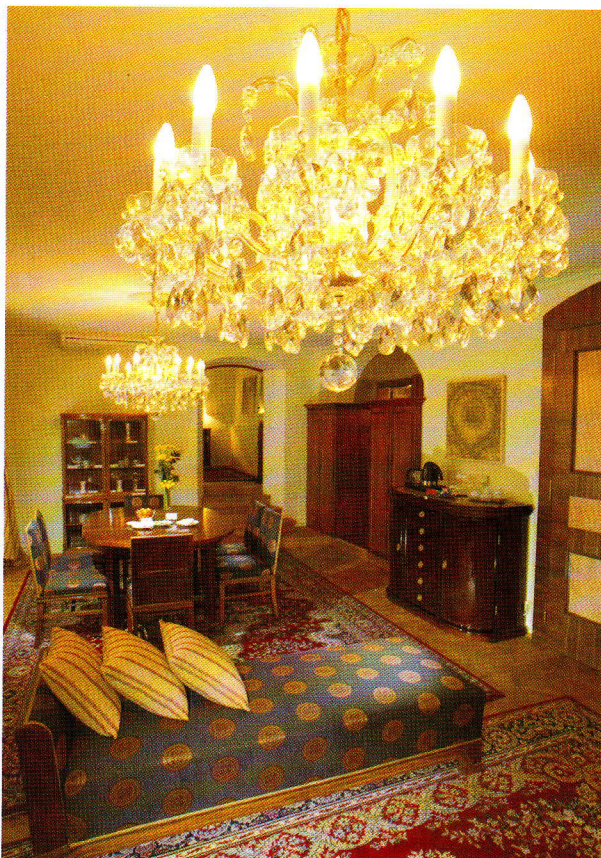
Grande suite très cossue, dans un esprit Premier Empire, marquant l'influence du style français.

Enfin, un centre de beauté propose des soins à la carte et un jacuzzi. Un point de chute parfait, à seulement quelques minutes à pied ou en tramway du centre ville, entre le quartier de la Mala Stana et celui d'Hradcany.