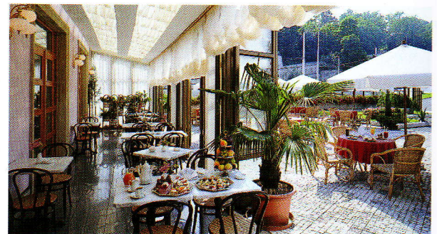
Véranda et terrasse d'été : de larges portes se déplient pour ne créer qu'un seul espace entre l'intérieur et l'extérieur.

Enfin, un centre de beauté propose des soins à la carte et un jacuzzi. Un point de chute parfait, à seulement quelques minutes à pied ou en tramway du centre ville, entre le quartier de la Mala Stana et celui d'Hradcany.