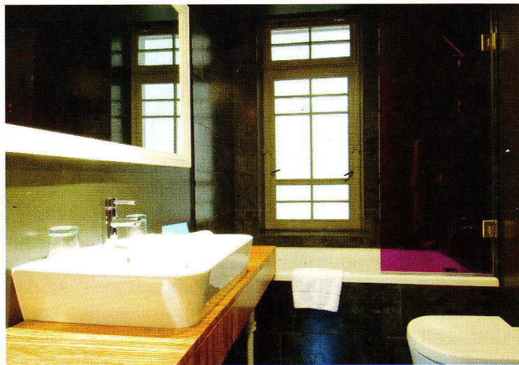
Salle de bain laquée noire, ou comment jouer sur les volumes en créant un espace hors normes.

The Icon boutique Hôtel se situe entre modernité et histoire, puisque le bâtiment d'origine date du XIXe siècle. Dans Nové Mesto , « nouvelle ville » en tchèque, aujourd'hui quartier des artistes, à la lisière du Stare Mesto , il se trouve également à quelques rues du célèbre Musée Mucha ou de la place Venceslas. Icon a été conçu comme un hôtel décontracté et convivial, ce que l'on ressent dès l'arrivée. Le confort des clients n'est pas oublié, pour preuve les lits Hänstens, faits à la main, les meilleurs du monde qui vous garantissent un sommeil exceptionnel, ou les coffres à empreinte digitale, tellement simples d'utilisation. Côté décor, le propriétaire a joué sur le design et la modernité dans les 31 chambres, avec un mélange de couleurs et de matières : Le mobilier Hala se marie avec le parquet en bois, les placards gris et faux bois, et les dessus de lit et rideaux violets.... Les salles de bain en noir et les éléments blancs offrent une touche de style