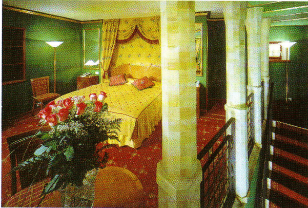
Suite « lune de miel » : chambre donnant sur une mezzanine. On remarquera l'alliance de couleurs tendance (le jaune, le rouge, le vert reviennent en force) dans une conception traditionnelle.