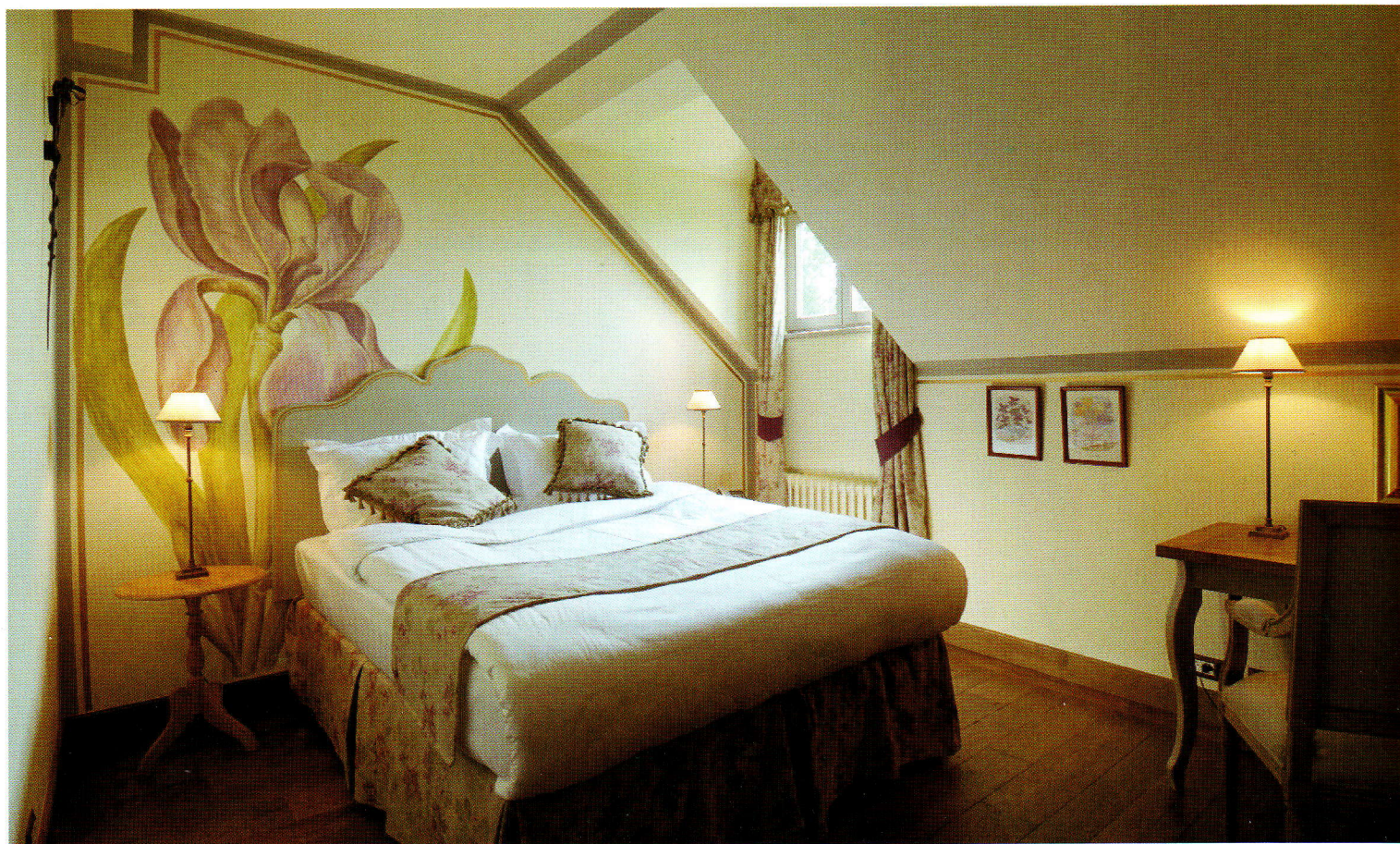
Chaque chambre est décorée sur le thème d'une saison ou d'un continent. Une simple peinture dans une chambre mansardée transforme la pièce en espace d'exception.