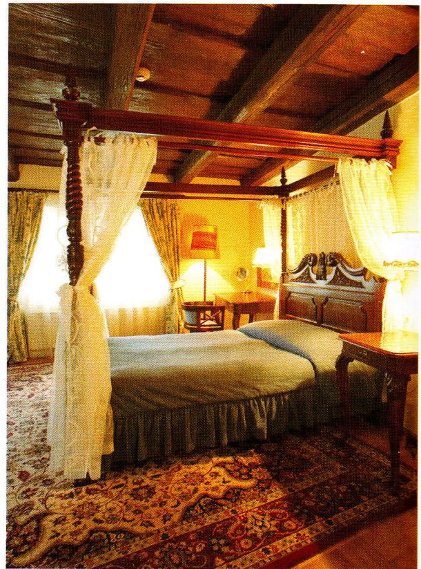
Suite présidentielle, avec larges poutres et plafond de bois, mettant en avant une image cosy et chaleureuse, comme dans certains greniers aménagés en d'anciennes demeures.

Les 38 chambres et suites sont décorées avec goût, toutes différemment : beaux meubles des années 30 et lustres en cristal dans certaines, lits à baldaquin pour d'autres. Certaines offrent une vue sur Prague, même depuis la salle de bain alors que d'autres sont au calme d'une ravissante impasse. Une terrasse permet de déjeuner ou dîner dehors aux beaux jours, tandis que la cheminée de la salle à manger, toute de rouge vêtue, réchauffe les soirées d'hiver autour d'un verre de vin, en provenance de la cave qui recense plus de 200 références moldaves, tchèques et du monde entier.