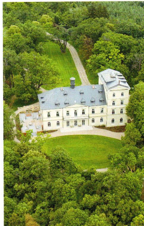
Le Château Mcely, une des plus belles haltes d'Europe Centrale, aux cœur des légendes de bohème

Le Chef, Libor Krušinský, compose une cuisine d'inspiration franco-tchèque, agrémentée d'anciennes recettes secrètes du Château. Et